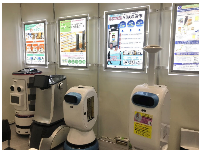
【下図】勢ぞろいしたAI自律歩行型ロボットたち