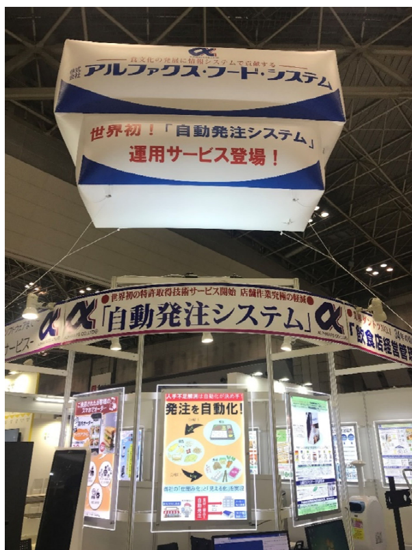
【左図】当社の展示ブース(東2ホール 2-N06)

オンライン展示会 URL https://www.jma-buyers.com/hcj/jp/