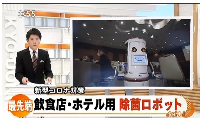
「今日ドキッ！北海道ニュースオープニング」

*本ニュースリリースにて紹介している画像はHBC北海道放送の御了解を得ております。