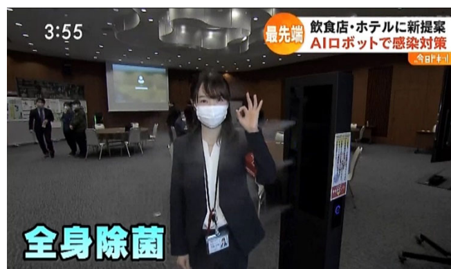
「入口近くの除菌ゲートで、レポーターさん全身除菌」