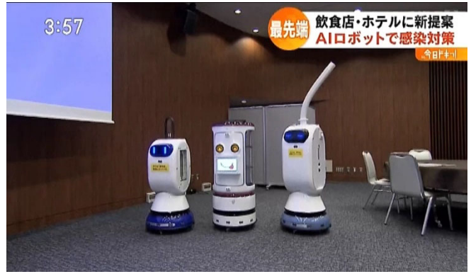
「話題の噴霧型空間除菌ロボットの紹介」：左上