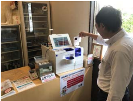
鮪業態（回転寿司含む）