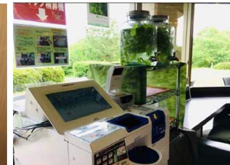
カフェ業態、パン販売業態